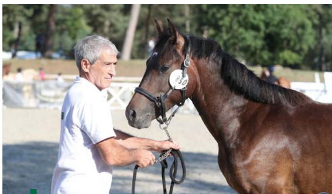
Odin Dahlia Gaci

Pour la petite histoire, la championne des poulinières non suitées fait partie de la famille du champion des foals mâles Prada Of de Oopss (par Lupin Amourier), noté à 63,50 et appartenant à Éric Galicia. Sa mère, Meehaamoore de Oopss (par l'étalon néerlandais Kenzo), sacrée championne suprême 2024, est la fille de Jeune Amour d'Extra !