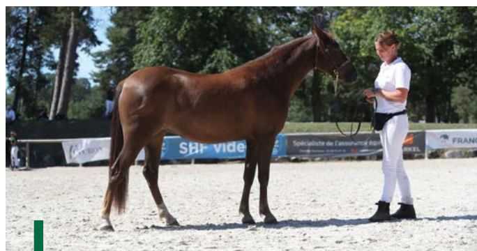
Nausicaa de Gaya