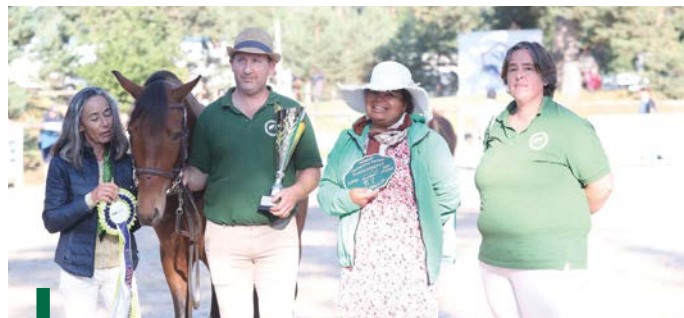
Milin Riant du Ker