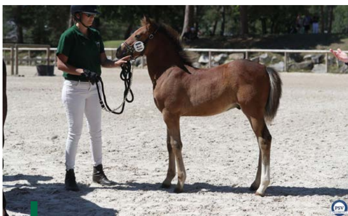
Prada Of de Oopss

Brickfield Victoria (par Wychwood Tornado), la mère, donc, de l'étalon européen Silverlea Simply Red (IPO 166), mais aussi du poney de Grand Prix de CSO Silverlea Status Quo (IPO 148, ISO 143) et de Silverlea Millenium (IPO 144). La britannique Doorage Pearlqueen (par Dorridge Top Button et Crabbswood Destiny par Rodlease Special Lad), née en 2007 chez Emma Collis, est deuxième (70,50). Notons qu'il s'agit de la mère de la New Forest de croisement Gazelle des Chenaies, gratifiée de la mention Élite dans la finale de CSO des 6 ans D et évoluant depuis pour les couleurs de l'Italie.