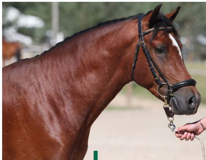
Mozart de Gascogne

(IPC 137, IPO 129) et de la poulinière New Forest Mistrale du Garon à l'origine de Gosh Bournon Bell (IPO 133) et Ulaly Bournon Bell (IPO 121). Il devance deux autres mâles notés également à plus de 70 : le vice-champion Mithrandir de Mirea (78) et le troisième Milor du Bois Bourdin (72), tous deux issus d'un étalon de l'élevage du Gévaudan.