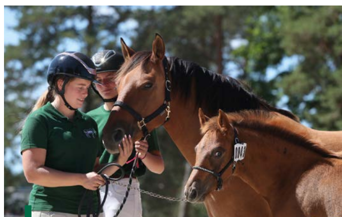
Pink Panther d'La Ju