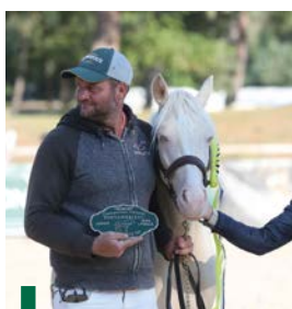
Nacre du Bois Bourdin

Dans la classe des mâles de 2 ans, le splendide Nim DC (par Jimmendor de Florys, Pfs et Fine de Chauménçon, Nf par Emmickhoven's Diego), né pour le compte de l'EARL de Chauménçon, s'impose sans contestation. Les juges ont attribué au propre frère d'Opaline DC un beau 84/100, le plaçant devant