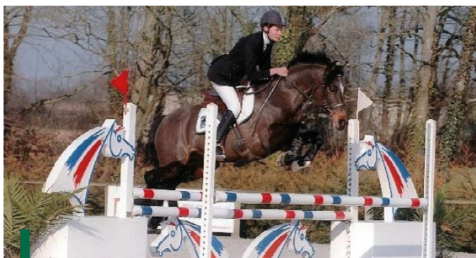
L'étalon New Forest Glen de l'Aumont

maniaque, moi, à ce niveau-là. Sur une croupe légèrement cassée, vous pouvez natter la queue pour la lui dégager, ce n'est pas plus mal, cela peut donner un demi-point de plus. Pour les 3 ans, par exemple, le cavalier préparateur joue beaucoup, c'est même un métier. Au pas, combien de cavaliers ne savent pas mettre leur poney dans un pas actif ? On veut un pas en avant. Ce sont des petits détails qui font la différence.