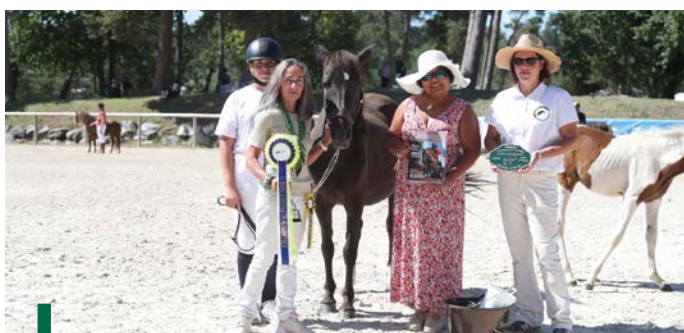
Best Of de Oopss