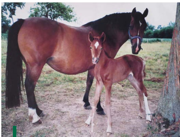
La poulinière Silverlea Martine