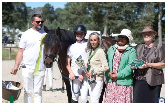
Jeune Amour d'Extra

Notons également que les pouliches des deux premières poulinières du classement se sont octroyées les deux premières places de la classe des foals femelles. Plume O Vent Gascogne (par Kennedy Bournon Bell) reçoit la note de 69,50, soit 0,5 point de plus que sa première dauphine Pixyla Blue Spark (par Phadraigs Sullivan).