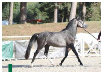
Malios du Bahais