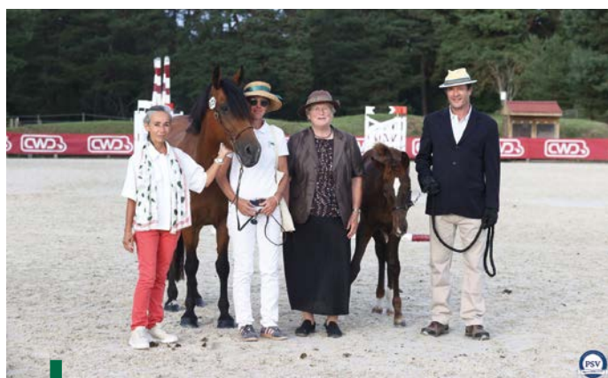
Carmen de Gascogne