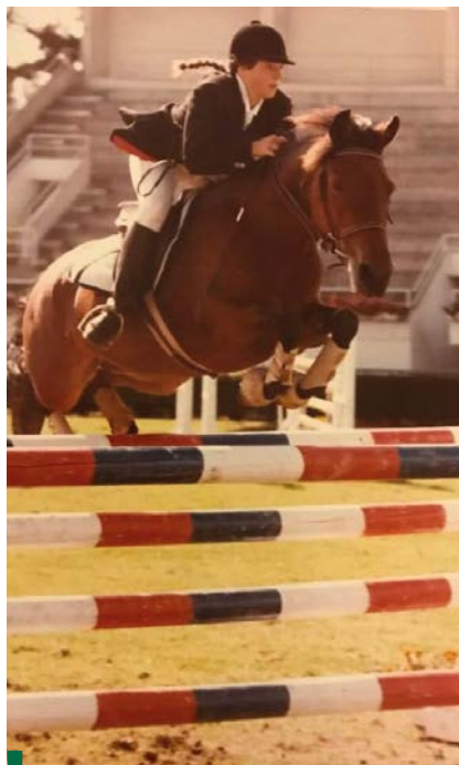
Nuit d'Été montée par Emmanuelle Rabillon

amusée, en rappelant les qualités de sa complice : « c'était une ponette extraordinaire, elle avait beaucoup de sang et allait dans le feu ! ».