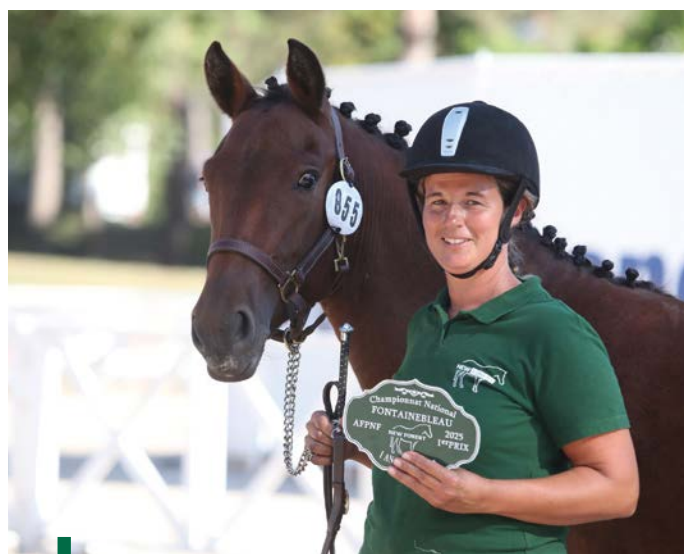
Or Fée d'Arlange