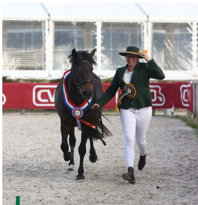
Mauve des Deucet

n'est pas en reste puisque ses protégées, Marquise et Misslady des Étoiles, toutes deux filles du néerlandais Kenzo, s'adjugent la deuxième et troisième place (74,50 et 74). Marquise présente un pedigree empreint du sang de bons sportifs : c'est une fille de Royale de l'Aumont (par Karisto de l'Aumont - fils de l'européen Shining Starr Aristo - champion des 4 et des 5 ans en CCJP de CSO puis classé jusqu'en Grand Prix) et de l'une des poulinières phares de l'élevage de Marc Bernardin, Soon des Étangs (par Jolly des Ifs), à l'origine, entre autres, du poney de Grand Prix de CSO Queyras de l'Aumont et d'Eliss de l'Aumont, la deuxième mère du double champion d'Europe de concours complet Flash des Étoiles. De la même souche maternelle, Misslady descend, quant à elle, de la poulinière Lady de l'Aumont (par Glen de l'Aumont, vice-champion suprême du National New Forest de Tours en 1996, lui aussi performant jusqu'en Grand Prix de CSO), sœur utérine de la mère de Flash des Étoiles.