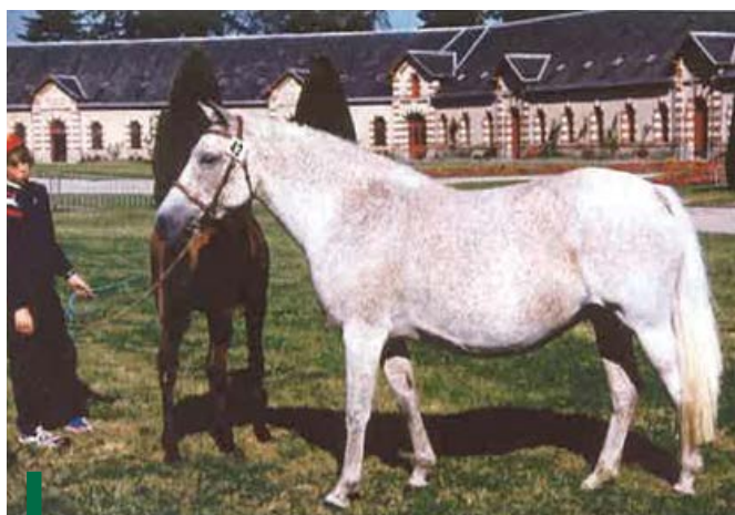
Soon des Étangs au Haras de Saint-Lô, en 1994