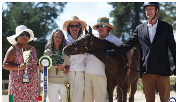
Plume O Vent Gascogne