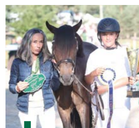
Makoo d'Ainara Oopss